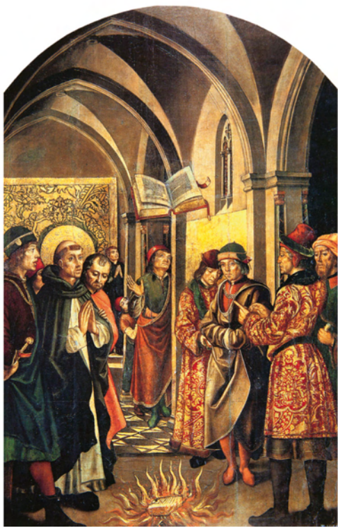
Pedro Berruguete La prueba del fuego Ca. 1471. Tabla Museo del Prado