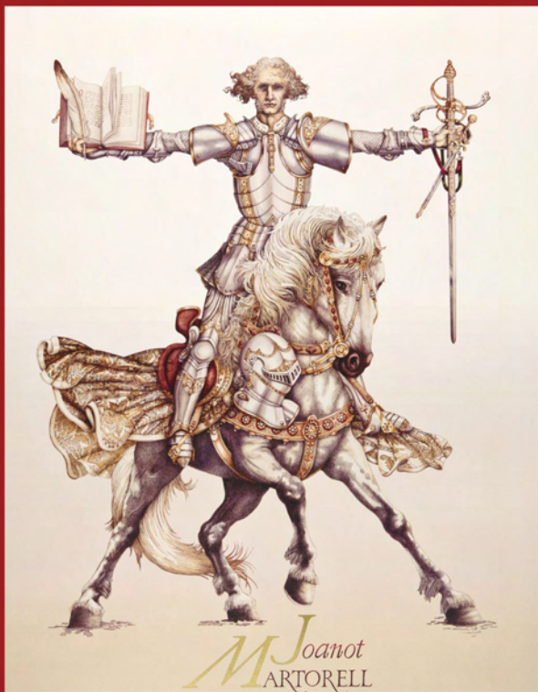
Joanot Martorell visto por Manuel Boix 2010