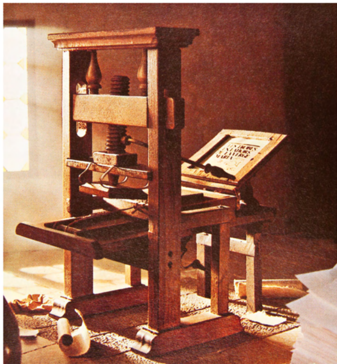
Imprenta similar a las utilizadas en Valencia por Palmart y Vitzlán