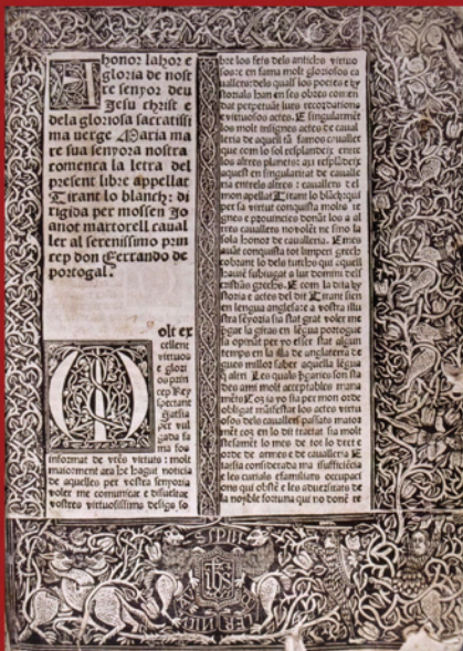
Los incunables carecían de portada. Primera página de la edición de 1490 del Tirant lo Blanc , hecha per Spindeler. Ejemplar de la Universitat de València