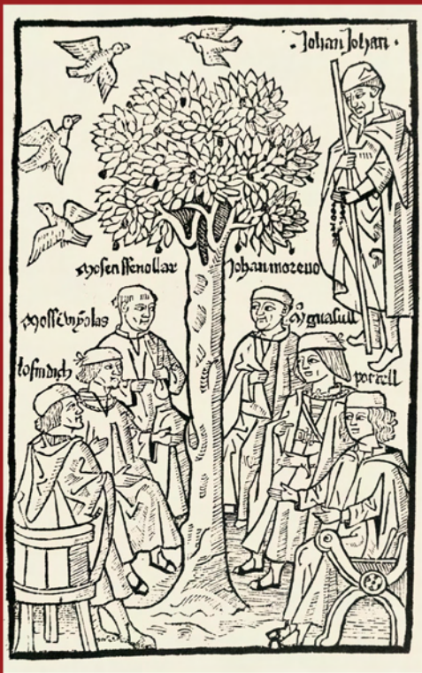
Xilografia sacada de Lo procès de les olives Valencia: Lope de Roca, 1497 Biblioteca Històrica. Universitat de València