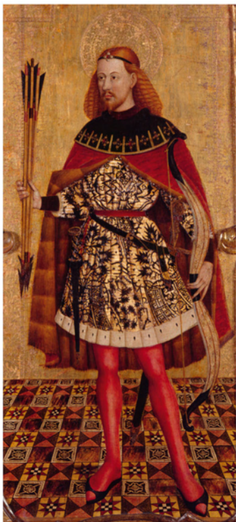
San Sebastián (supuesto retrato de Ausiàs March) Siglo xv. Col·legiata de Xàtiva