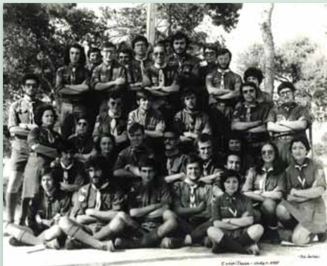
Arriba: CURSO DE FORMACIÓN DE AVDE. El Vedat de Torrente (Valencia), 1975.