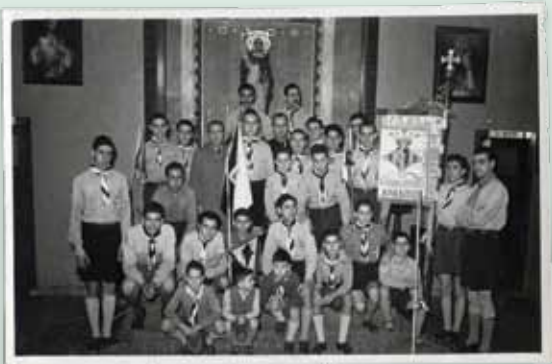
INTEGRANTES DEL GRUPO III SAN VICENTE FERRER. Casa de los Obreros San Vicente Ferrer de Valencia, 1954.