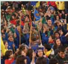
FESTIVAL DE LA CANCIÓN DEL MEV. Nazaret (Valencia), febrero 2010.