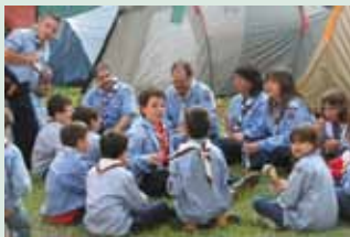
LOBATOS DEL GRUPO SANT CRISTÒFOL DE ALBORAYA EN LOS ACTOS DE CELEBRACIÓN DE SANT JORDI, PATRÓN DE LOS SCOUTS. Burriana (Castellón), 2009.