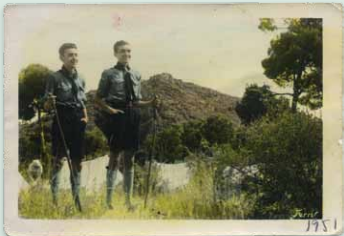
ROVERS DE LOS BOY SCOUTS DEL PAÍS VALENCIÀ. Gilet (Valencia), 1951.