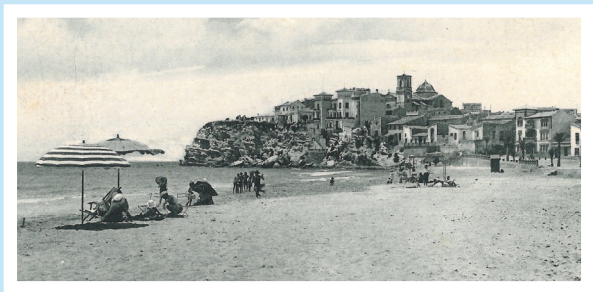
El antiguo Benidorm, antes de la proliferación turística (ca. 1950)