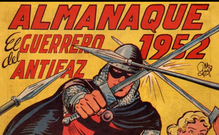
Piel de Lobo . Editorial Maga, 1960. Il·lustració de Manuel Gago. Almanac 1952 d'El Guerrero del Antifaz . Editorial Valenciana. Il·lustració de Manuel Gago.