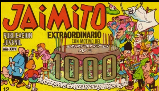
Jaimito. Especial número Mil. Editorial Valenciana, 1968. Il·lustració de Soriano izquierdo.

A l'hora d'elaborar una història del segle XX, d'intentar comprendre els pensaments de l'home de les nostres societats, els seus valors i els seus somnis, esdevé obligatori recórrer a l'evolució dels mitjans de masses, fidel reflex de la mentalitat de cada període històric. La historieta gràfica, nascuda a Espanya pràcticament amb el segle, hi ha jugat sovint un immerescut paper de parent pobre respecte de la importància que com a mitjà de comunicació ha posseït. I, no obstant això, quan s'evoca el que va ser la societat espanyola dels anys centrals del segle passat, es constata que els humils tebeos van ser la forma d'accés als llenguatges artístics més difosa: es troben en tots els ambients i llocs, els seus títols es compten per centenars, es consolida a l'entorn de la historieta una indústria proveïda pel treball de centenars de professionals... De l'escola al quarter, del