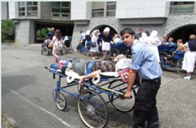
MEMBRE DE SCOUTS VALENCIANS PRESTANT SERVICI EN EL PELEGRINATGE DE MALATS DE LA DIÒCESI DE VALÈNCIA. Lourdes (França), 2011.