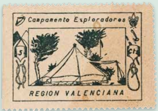
SEGELL DEL CAMPAMENT DE LA FEDERACIÓ REGIONAL VALENCIANA D'EXPLORADORS. Finals de la dècada de 1920.

Biblioteca Valenciana Nicolau Primitiu. Arxiu de la Fundació Scout Sant Jordi.