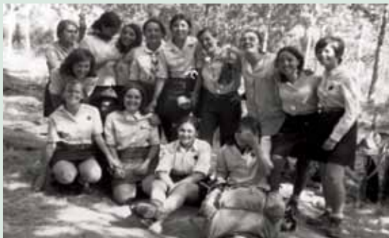
XIQUES GUIES DELS GRUPS III I XIII DE CAMPAMENT EN LA ESCALERUELA. Sarrión (Terol), juliol 1970.