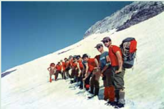
TROPA DE PIONEROS DEL GRUPO X EN UN CAMPAMENTO DE VERANO. Pirineos de Huesca, 1969.